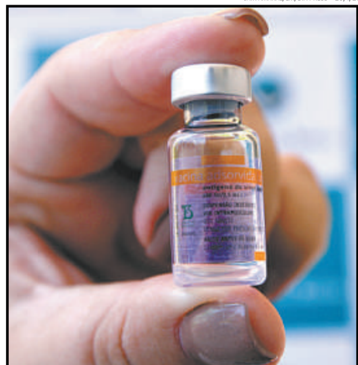
Vacina produzida pelo Butantan com insumos da China mostra eficácia